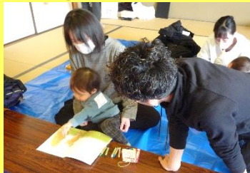
あっという間に絵本に電車が走ったよ!