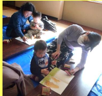
ママ! みて～! いっぱい描けた!!