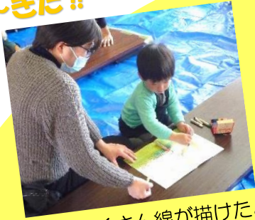
力強くたくさん線が描けたよ!