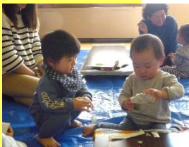
折り紙を詰め詰め…