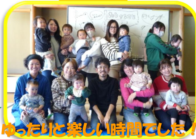
「ゆったりと楽しい時間でした!」