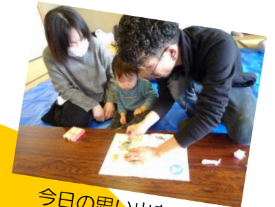
今日の思い出を記念に写真を貼ってもらったよ!