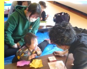
初めての人にも笑顔を見せられました!