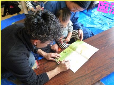
先生といっしょにお絵描き!